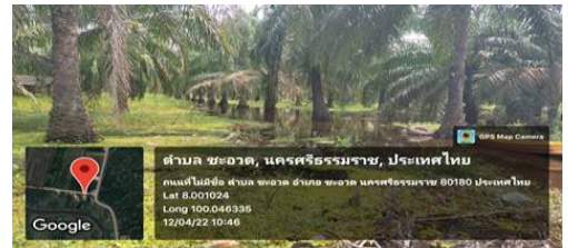
ต.ชะอวด อ.ชะอวด จ.นครศรีธรรมราช

สาเหตุ บริเวณห่อมความกดอากาศต่ำปกคลุมบริเวณภาคใต้ เคลื่อนตัวลงสู่ทะเลอันดามัน ทำให้ลมฝ่ายตะวันออกที่ปกคลุมอ่าวไทย และภาคใต้มีกำลังแรงขึ้น ส่งผลให้ช่วงวันที่ 2-6 เม.ย.65 มีฝนหนักหลายพื้นที่ และมีฝนหนักมากบางแห่ง โดยเฉพาะพื้นที่จังหวัดนครศรีธรรมราช ปริมาณฝนที่เริ่มตกหนักตั้งแต่วันที่ 4 เม.ย.65 ส่งผลให้ระดับน้ำในคลองธรรมชาติสายต่างๆ มีระดับน้ำเพิ่มขึ้น เอ่อล้นเข้าท่วมพื้นที่ลุ่มต่ำในหลายพื้นที่