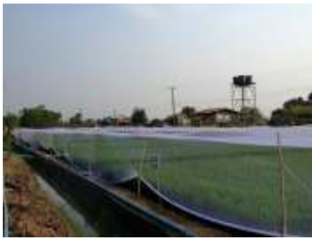
ใช้ระบบท่อส่งน้ำ ชิงตาข่ายกันนก และล้อมแปลงกันหนู