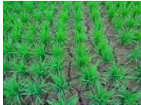
การแตกของหน้าดินเมื่อรดส่งน้ำ