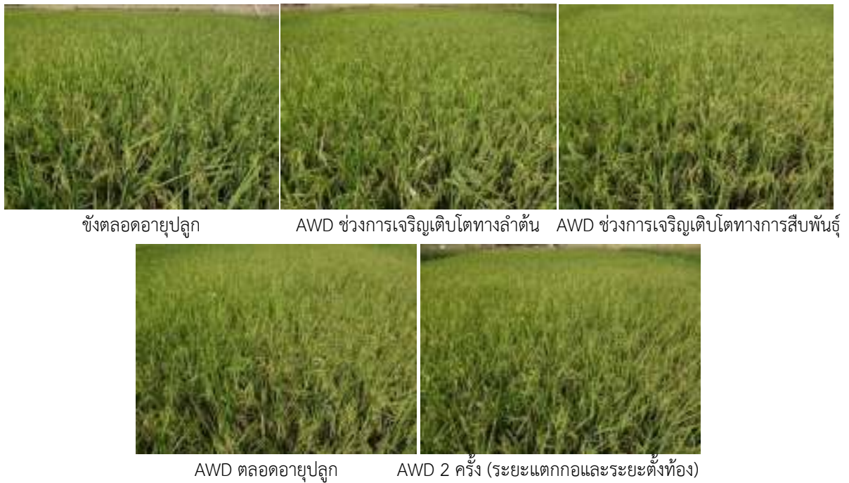
ภาพที่ 2 การออกรวงของข้าวแต่ละวิธีการ (ก่อนเก็บเกี่ยว 1 สัปดาห์)