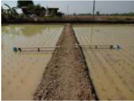
วางท่อวัดระดับน้ำ