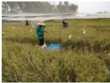
เก็บเกี่ยวผลผลิต