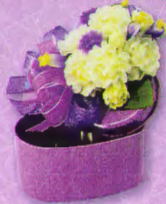
6 กล่องหัวใจใส่รัก ราคา 190.- บาท