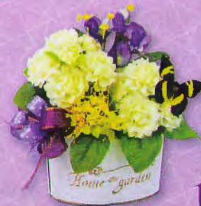
10 แจกันมะลิบาน...หวานรัก ราคา 320.- บาท