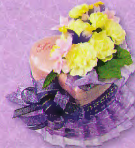
9 กล่องดนตรี...สุนทรีแห่งรัก ราคา 300.- บาท