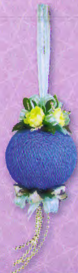
5 โม่บาย...สายใยรัก ราคา 150.- บาท