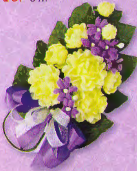
3 ช่อมะลิ "ร้อยรวมรัก" ราคา 50.- บาท