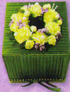
8 กล่องทิชชู...เขี้ยวขจิตวิรัก ราคา 250.- บาท