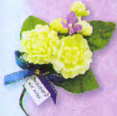
2 ช่อมะลิ "รวมใจรักแม่" ราคา 20.- บาท