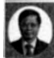
ดำเนินการเสวนาโดย รศ.ดร.นิพนธ์ พัวพงศกร นักวิชาการเกียรติคุณ TDR

11.30-12.00 สื่อมวลชนและผู้เข้าเสวนาซักถามและอภิปราย