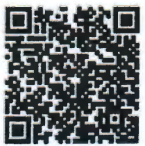
QR Code แบบลงทะเบียน

ในการนี้ กสช. จึงขอให้ผู้ที่สนใจเข้ารับการฝึกอบรมโครงการดังกล่าว สามารถแจ้งความประสงค์ โดยลงทะเบียน Online https://goo.gl/forms/Np6OPO0mMXvIXzNo2 หรือ Scan QR Code ตามที่แนบนี้ หากมีข้อสงสัยสามารถสอบถามเพิ่มเติมได้ที่ นายวาทิตย์ บาลทิพย์ ส่วนส่งเสริมการมีส่วนร่วมด้านบริหารจัดการนี้ โทรศัพท์ ๐ ๒๖๖๔ ๓๗๗๕ ต่อ ๑๒๖