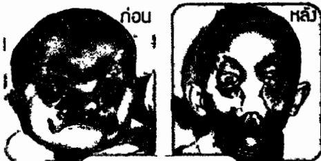
โรคใบหน้าแหงแต่กำเนิด