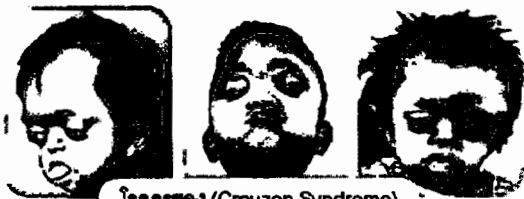
โรคครูซง (Crouzon Syndrome)