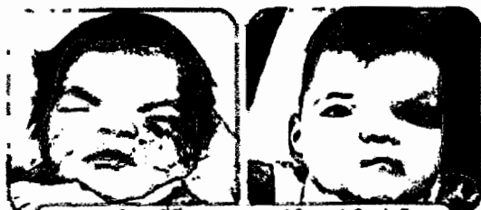
ความพิการที่มีกระดูกขาอยู่ตำแหน่งผิดปกติ