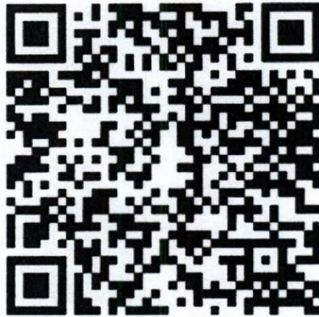
QR Code รางวัลต้นแบบด้านสิทธิมนุษยชน ปี ๒๕๖๒