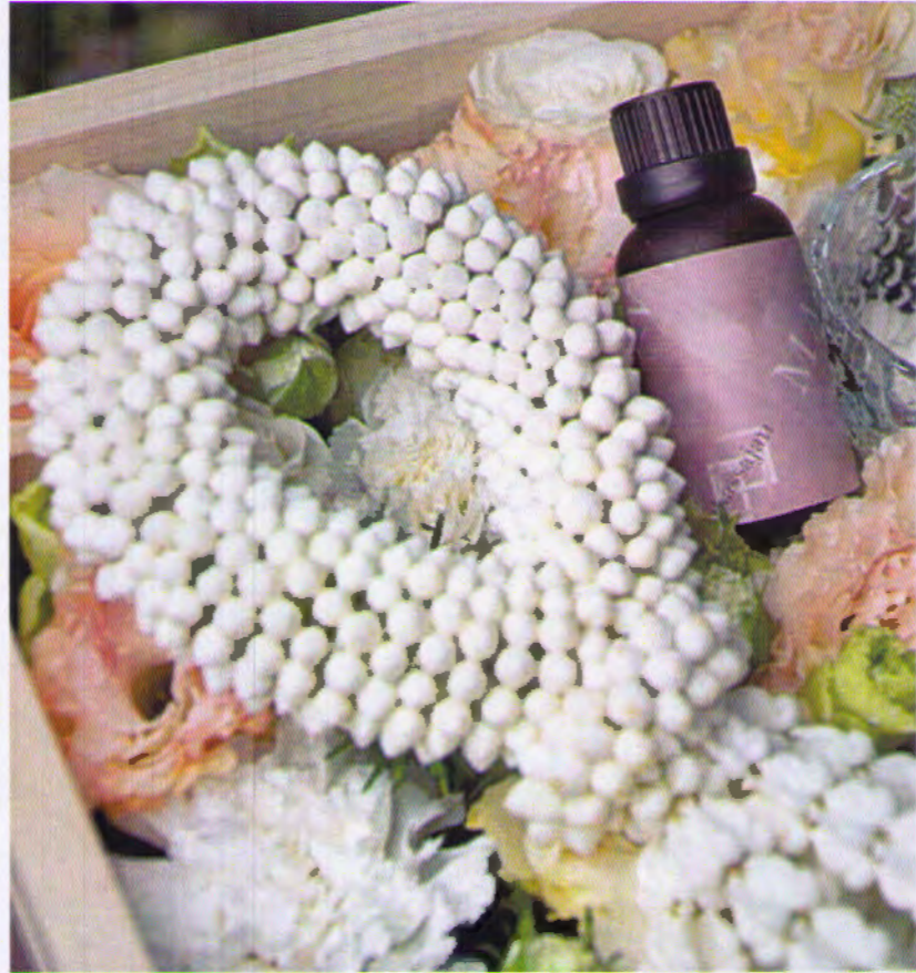
ตัวอย่างชุดดอกไม้พร้อมของขวัญ