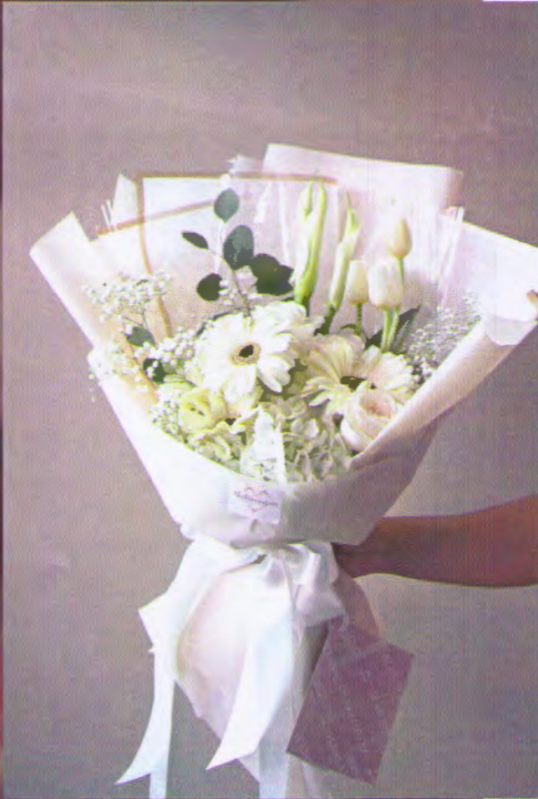
ตัวอย่างช่อดอกไม้