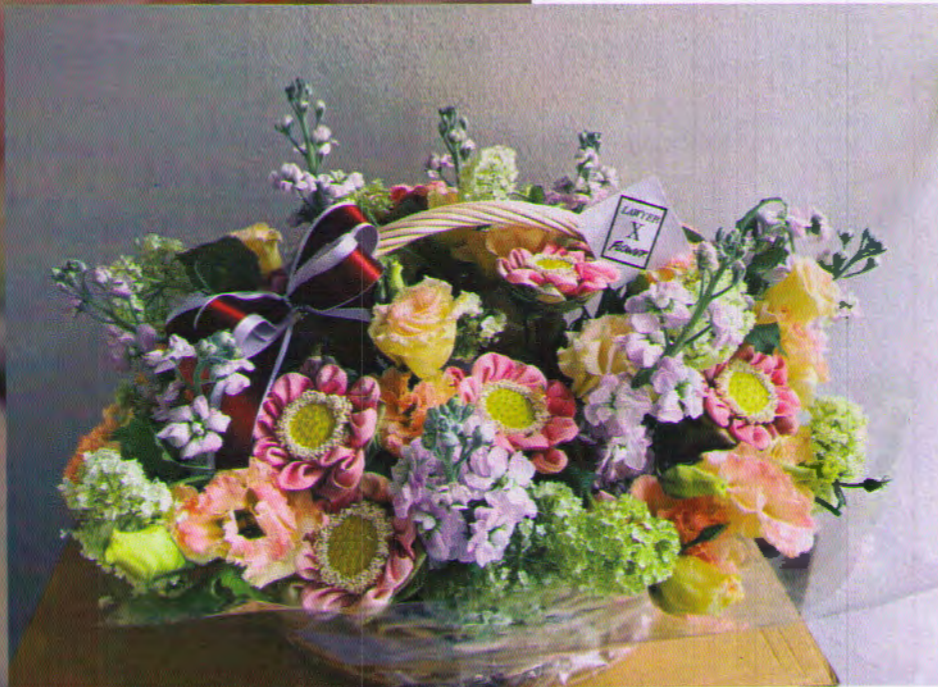
ตัวอย่างกระเช้าดอกไม้