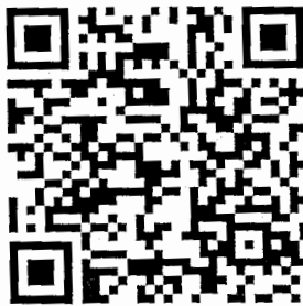
แบบตอบรับ รายงานประจำปี ๒๕๖๒