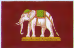
ธงเรือหลวง หรือธงชาติสยาม (รัชกาลที่ ๕ ร.ศ. ๑๑๐ ร.ศ. ๑๑๖ และ ร.ศ. ๑๑๘)