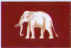
ธงเรือหลวง หรือธงราชการ (รัชกาลที่ ๔ ร.ศ. ๑๑๖ ร.ศ. ๑๑๘ และ ร.ศ. ๑๒๗)