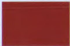
ธงแดง (รัชกาลที่ ๑-๒)