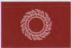
ธงเรือหลวง (รัชกาลที่ ๑)