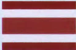
ธงแดงขาว ๕ ริ้ว (พ.ศ. ๒๔๕๗)