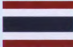
ธงชาติไทย หรือธงไตรรงค์ (ปัจจุบัน)

พระบาทสมเด็จพระมงกุฎเกล้าเจ้าอยู่หัว รัชกาลที่ ๖ ทรงพระกรุณาโปรดเกล้าฯ ให้ตราพระราชบัญญัติธงขึ้นใหม่ในพุทธศักราช ๒๔๖๐ เนื่องจากในสยามสมัยนั้นจึงเป็นรูปสี่เหลี่ยมรี ขนาดกว้าง ๒ ส่วน ยาว ๓ ส่วน มีแถบสีน้ำเงินแกว่งซึ่งแบ่ง ๓ ของขนาดกว้างแห่งธงอยู่กลาง มีแถบขาวกว้าง ๑ ส่วน ซึ่งแบ่ง ๖ ของขนาดความกว้างแห่งธงข้างละแถบ และมีแถบสีแดงกว้างเท่าแถบขาวประกอบขึ้นนอกอีกข้างละแถบ และทรงเห็นว่า “ธงไตรรงค์” และกำหนดความหมายของสีธงชาติไว้ว่า สีแดง หมายถึง ประชาชน สีขาว หมายถึง ศาสนา และสีน้ำเงิน หมายถึง พระมหากษัตริย์ ซึ่งธงหรือธงชาติไทย ถือเป็นสัญลักษณ์อันสูงสุดของชาติเป็นสิ่งเตือนใจให้อนุชนได้รำลึกถึงการเสียสละเลือดเนื้อของบรรพบุรุษเพื่อรักษาไว้ซึ่งแผ่นดิน และร้อยดวงใจคนทั้งชาติให้หล่อหลอมความรักสามัคคี สร้างเสริมความภูมิใจในความเป็นชาติ ก่อเกิดเป็นพลังในการพัฒนาชาติไทยให้วัฒนาสถาพร