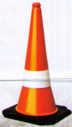
Traffic Cone Rubber Base