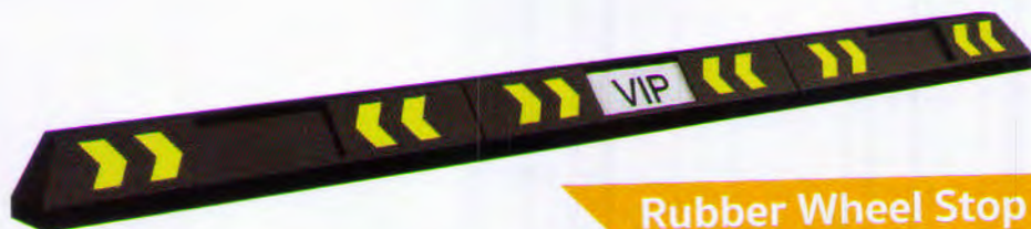
Rubber Wheel Stop