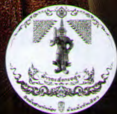
สติ๊กเกอร์ ท่านท้าวะสังกะอสูร (ติดหน้ารถยนต์)

วันพุธ ที่ ๒๑ ตุลาคม ๒๕๖๓ เวลา ๑๓.๓๐ น. พิธีบวงสรวงขออนุญาตท่านท้าวะสังกะอสูร เพื่อขอจัดสร้างวัดกุ่มงค ท่านท้าวะสังกะอสูร