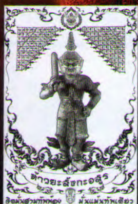
ผ้ายันต์ท่านท้าวะสังกะอสูร