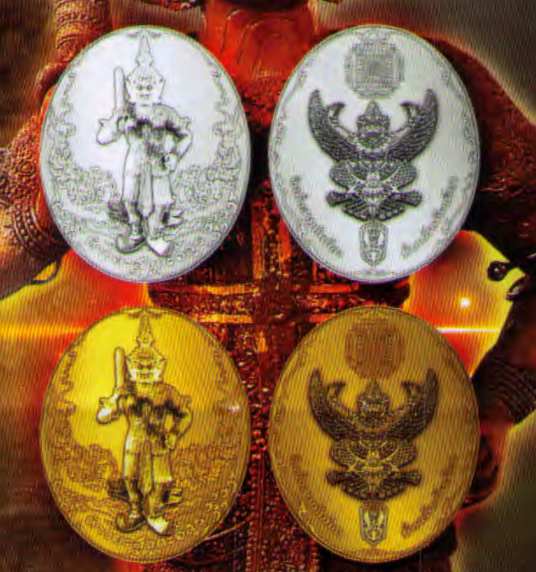
เหรียญท่านท้าวะสังกะอสูร รุ่น อำนาจ บารมี คู่ภัย