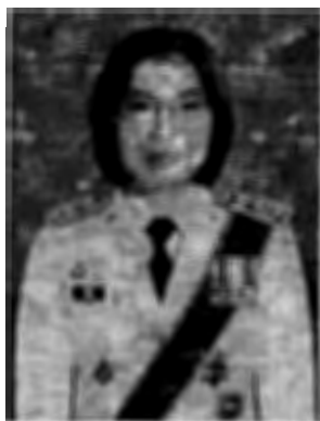
๓. นางสาวอัญชลี เจริญทรัพย์ อดีตรองผู้ว่าการตรวจเงินแผ่นดิน