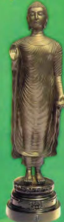
แบบสีเหลือง