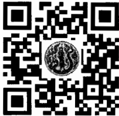
ใบสั่งจองพระพุทธรูป

ผู้ตรวจราชการกระทรวงเกษตรและสหกรณ์ ประธานกรรมการสวัสดิการสำนักงานปลัดกระทรวงเกษตรและสหกรณ์