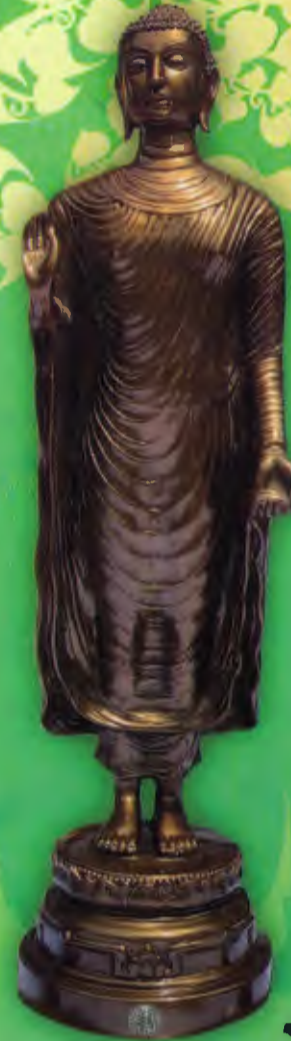
แบบมันปู

กระทรวงเกษตรและสหกรณ์สถาปนาครบรอบ ๑๓๐ ปี