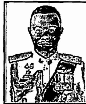
พลตำรวจเอก ธีรธร เพราะสุนทร (ด้านอื่น ๆ ที่จะยังประโยชน์ต่อการปฏิบัติหน้าที่ ของ กสทช. (ด้านกฎหมาย))