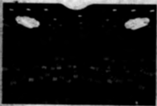
กิจกรรมการอบรมภายในสำนักงาน