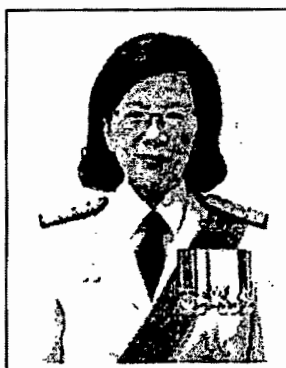
นางสาวนารี ตันตเสถียร อธิบดีอัยการ สำนักงานที่ปรึกษาอัยการ

หากท่านผู้ใดมีข้อมูล ข้อเท็จจริง และข้อคิดเห็นเกี่ยวกับบุคคลผู้ได้รับการเสนอชื่อ ให้ดำรงตำแหน่งอัยการสูงสุด