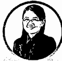
รศ.ดร.อรวิธา ชัยประสิทธิ์ รองผู้อำนวยการศูนย์วิจัยประชากร และสุขภาพเมือง