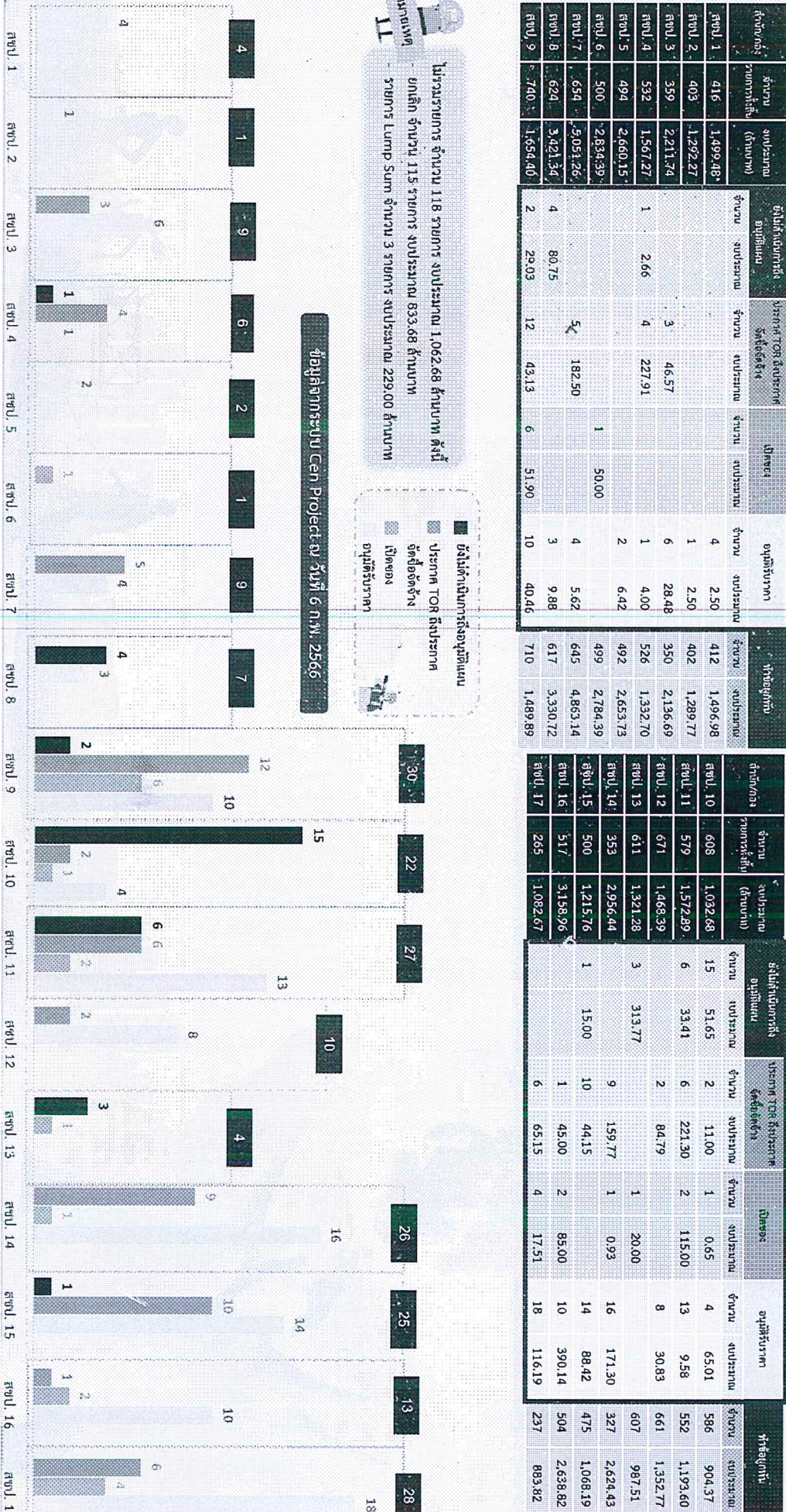
รูป ๖ ยังไม่ก่อหนี้ผูกพัน 308 รายการ

โครงการราชการ จำนวน 118 รายการ งบประมาณ 1,062.68 ล้านบาท ยกเลิก จำนวน 115 รายการ งบประมาณ 833.68 ล้านบาท รายการ Lump Sum จำนวน 3 รายการ งบประมาณ 229.00 ล้านบาท