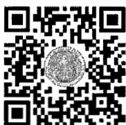
ระบบเข้าบูชา

ผู้ตรวจราชการกระทรวงเกษตรและสหกรณ์ ประธานกรรมการสวัสดิการสำนักงานปลัดกระทรวงเกษตรและสหกรณ์