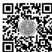
คู่มือเข้าบูชา