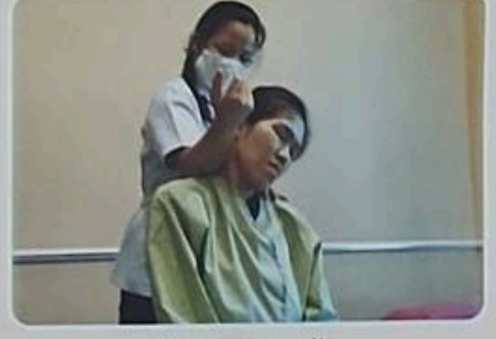
อาชีพนวดแผนไทย