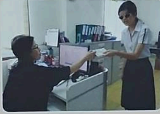
บริการหนังสือเสียงเดซี