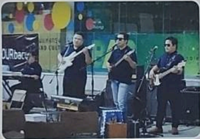
นักร้อง นักดนตรี