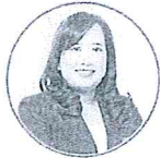
พศ.ดร.นุชริกา 軒