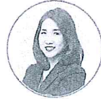
พศ.ดร.อภิญา บัณฑิตวุฒิสกุล