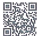
QR-Code เพื่อจองห้องพัก

โทรศัพท์: ๐๒-๔๒๒-๙๒๒๒ E-mail : rsvn@royalriverhotel.com