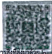
เอกสารสิ่งที่ส่งมาด้วย ๒