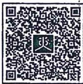
เอกสารสิ่งที่ส่งมาด้วย ๑