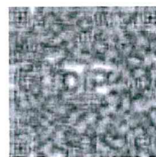
แบบฟอร์มขอโอน