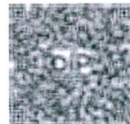
แบบฟอร์มงานบุคคล