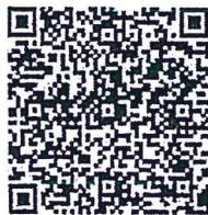
QR Code รายงานประจำปี ๒๕๖๕

การยางแห่งประเทศไทย Rubber Authority of Thailand