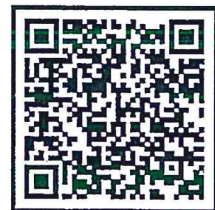
QR Code ประชาสัมพันธ์เล่มรายงานฯ

สำนักด้านทุจริตศึกษา โทร. ๐ ๒๕๒๘ ๔๘๐๐ ต่อ ๗๑๑๔