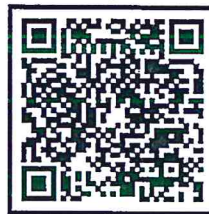
QR Code เอกสารเล่มรายงานฯ