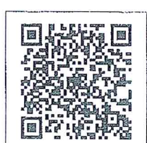
QR-Code เพื่อสอบถามข้อมูล