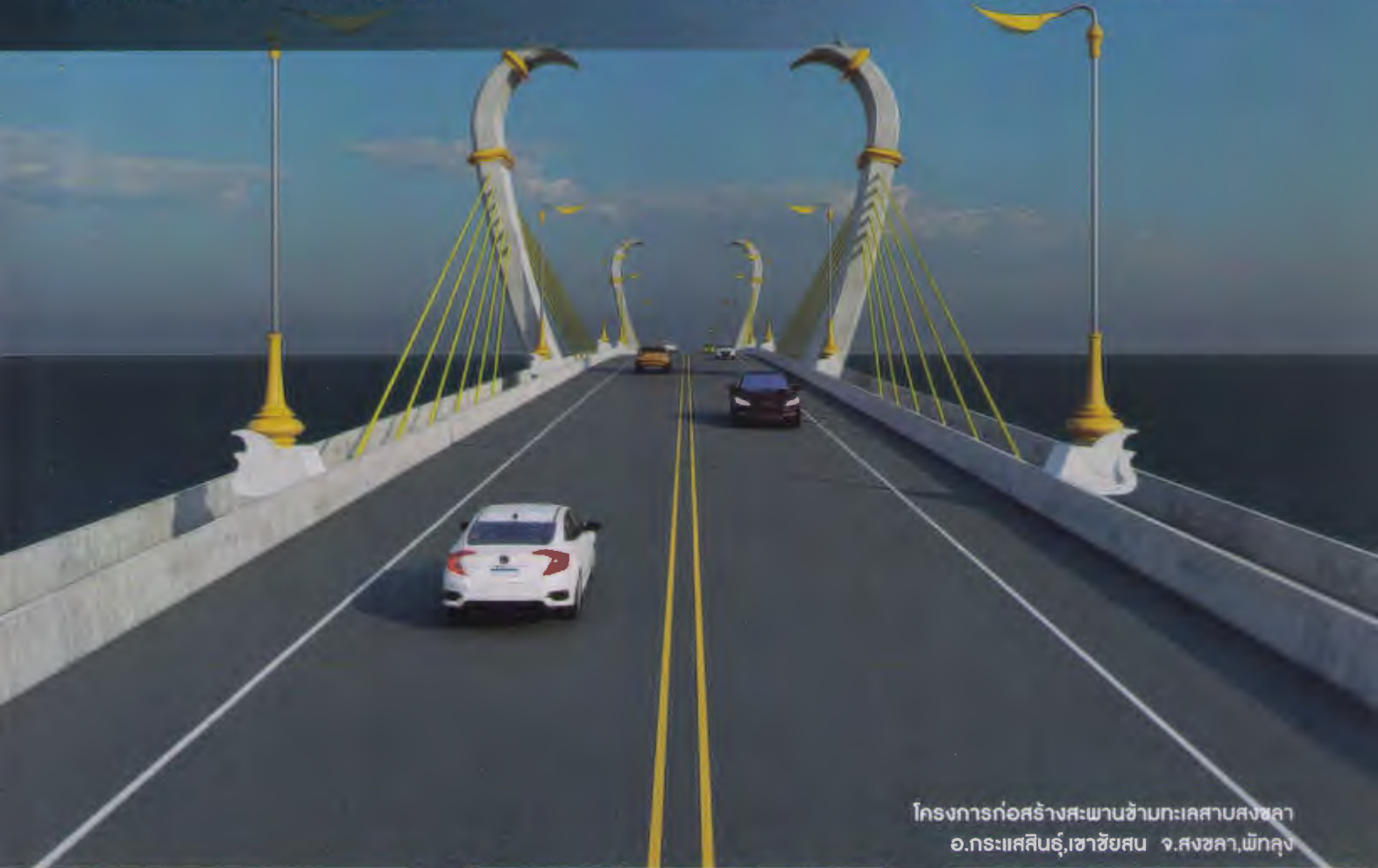
โครงการก่อสร้างสะพานข้ามทะเลสาบสงขลา อ.กระแสดินรู่, uezชัยสน จ.สงขลา, เพ็ทลุง