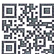
ระเบียบว่าด้วยการโอนงบประมาณรายจ่ายบูรณาการ และงบประมาณรายจ่ายบุคลากรระหว่างหน่วยรับ งบประมาณ พ.ศ. ๒๕๖๒