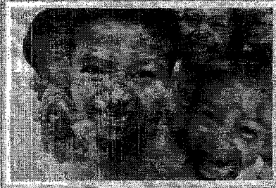
สมัคร เป็นธรรม สมาชิกธรรม