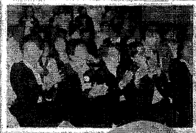
อบรม แรงงานภาค

ในทศวรรษที่ ๖๐ แผนพัฒนาสตรีของประเทศไทย จะมุ่งเน้น ๓ ประการ (สุขภาพ เศรษฐกิจ และสังคม)