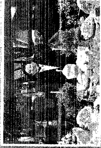
พระพุทธรูป