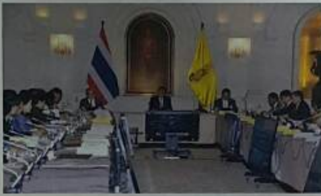
อ่านต่อหน้า ๕

บีโอไอออกมาตรการเร่งรัดการลงทุน เพื่อให้เกิดการลงทุนจริงภายในปี ๒๕๖๐