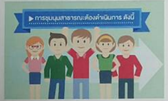
อ่านต่อหน้า ๑๒

รู้จักสาระสำคัญของ พ.ร.บ. การชุมนุมสาธารณะ พ.ศ. ๒๕๕๘ เพื่อการใช้สิทธิและเสรีภาพอย่างถูกต้อง