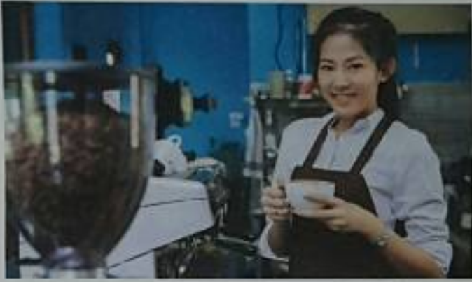
อ่านต่อหน้า ๔

๕ มาตรการช่วยเหลือธุรกิจเอสเอ็มอี เพื่อให้เข้าถึงแหล่งเงินทุนและเพิ่มขีดความสามารถในการแข่งขัน