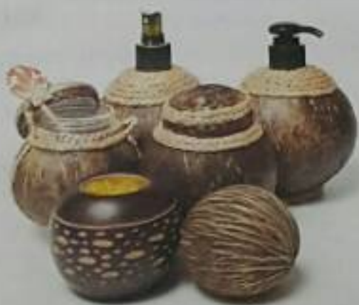
อ่านต่อหน้า ๖

นอกจากนี้ รัฐบาลยังคงส่งเสริมการลงทุนขนาดใหญ่ที่เกี่ยวข้องกับโครงสร้างพื้นฐานต่างๆ เพื่อวางรากฐานให้กับประเทศในระยะยาว และดูแลด้านการต่างประเทศ โดยเฉพาะการส่งเสริมการค้าการลงทุนระหว่างกัน และการรักษาความสัมพันธ์ระหว่างประเทศอีกด้วย