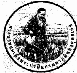
ด้านหน้า