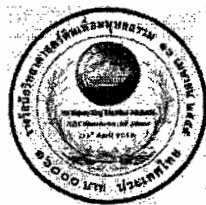
ด้านหลัง