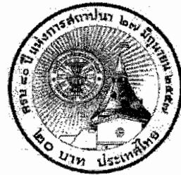
ด้านหลัง

รายละเอียดของเหรียญษาปณ์ที่ระลึก มีดังนี้