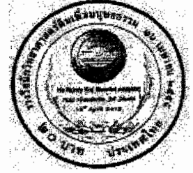
ด้านหลัง