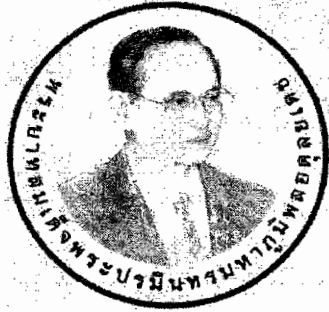
ด้านหน้า