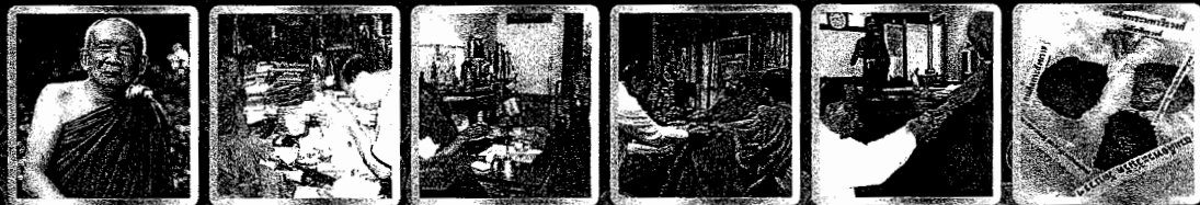
อ.สารพุดคุณ เจ้าพระคุณสมเด็จ ๑.สมเด็จพระสังฆราช ๒.สมเด็จพระมหาธีรราชเจ้า ๓.สมเด็จพระญาณวโรดม ๔.สมเด็จพระมหาธีรราชเจ้า ๕.สมเด็จพระวันรัต

หลักการและวัตถุประสงค์ : พระองค์ท่าน ทรงเป็นพระสังฆราชองค์ที่ ๑๙ แห่งกรุงรัตนโกสินทร์ ซึ่งทรงมีพระชนม์มายุ ๑๐๐ พรรษา ๒๑ วัน ซึ่งยังไม่เคยปรากฏแต่ก่อนมา และเพื่อเป็นการร่วมสืบสายพระพุทธศาสนาขององค์สมเด็จพระเจ้าอยู่หัวอริยราชูปถัมภ์ โดยการสร้างถาวรวัตถุในพระพุทธศาสนา ในรูปแบบของ "อาคารสังฆราช" ซึ่งทรงมีอายุ ๑๐๐ พรรษา ๒๑ วัน ในคราวฉลองของ พระครูวิมลธรรม สังกัด วัดบวรนิเวศวิหาร เพื่อประดิษฐานรูปหล่อสมเด็จพระสังฆราชองค์ที่ ๑๙ และพระประวัติ ของพระองค์ท่านและเสด็จสู่สวรรคาลัยแล้วก็ตาม ทั้งนี้เพื่อให้พุทธศาสนิกชนชาวไทยทุกท่าน แสดงถึงความกตัญญูต่อบุคคลชาติ ต่อพระองค์ท่านเป็นวาระสุดท้าย และเพื่อบอกเล่าถึงคุณงามความดีของท่านและได้หาความตั้งใจยิ่งใหญ่ ไว้ในพระพุทธศาสนาขององค์สมเด็จพระสังฆราชเจ้าในภพชาติที่เราได้มาเกิดเป็นชาวพุทธร่วมกันในชาตินี้