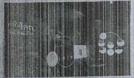
ภาพของหน้า 16

พัฒนาระบบงานด้านสร้างความรู้ได้เล็กและยาวนาน และการใช้กับบริษัทเพียงกับลงทุน SMEs ไทย