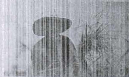
ภาพของหน้า 14

วิจัยที่ ๑ ศึกษาองค์ประกอบของ "สังคมสุขนิยมไทย ๒๕๕๙ จากปัจจัยเกษตรกรรมและสังคม"