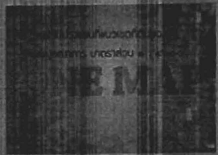
กรมการข้าว

กรมส่งเสริมการค้าระหว่างประเทศ เตรียมขยายบริการส่งเสริมการค้าระหว่างประเทศ