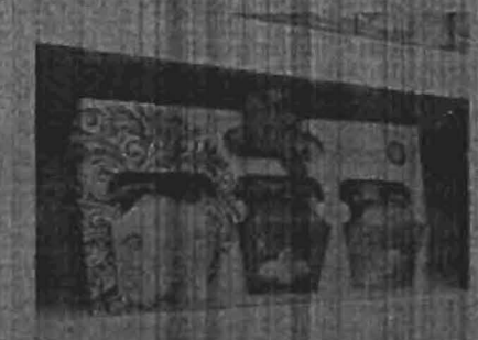
กรมการข้าว

เปิดตัว "แผนประชาธิปไตย" ศูนย์ข่าวประชาธิปไตย (DICE) ในเดือนมีนาคมปีหน้า ๒๕๖๐ เพื่อติดตาม