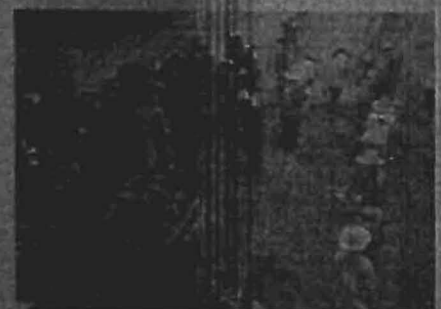
กรมการข้าว

รัฐบาลจับมือกับโครงการ "ต้นกล้า ๑ ล้านไร่" ส่งเสริมเกษตรกรที่ประสบปัญหาภัยแล้ง