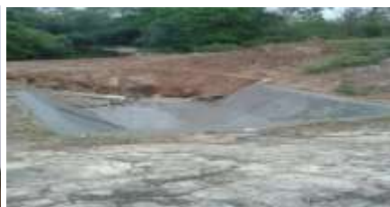
ขณะดำเนินการ