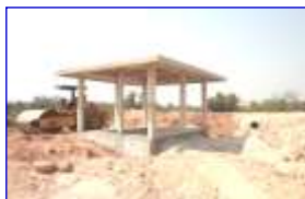
อาคารจ่ายน้ำ