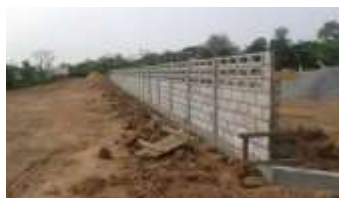
ขณะดำเนินการ