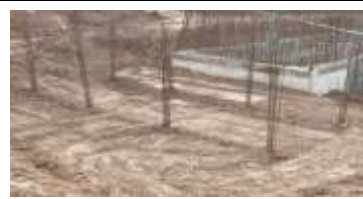
ขณะดำเนินการก่อสร้าง