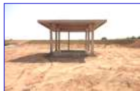
อาคารจ่ายน้ำ