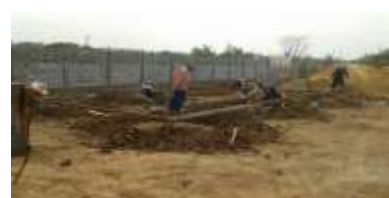
ขณะดำเนินการ