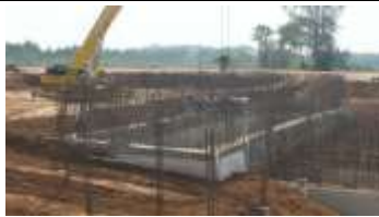
ขณะดำเนินการก่อสร้าง