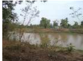
บริเวณสถานีสูบน้ำ