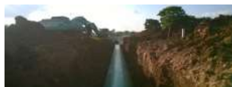
ขณะดำเนินการ