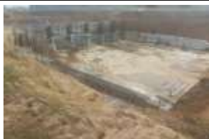
ขณะดำเนินการก่อสร้าง