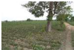
บริเวณสถานีสูบน้ำ