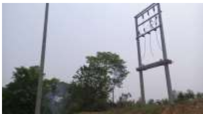
ขณะดำเนินการ