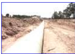
งานวางท่อ