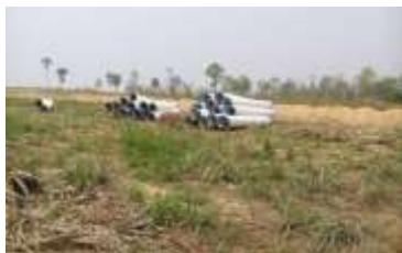
ขณะดำเนินการ