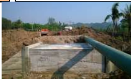
ขณะดำเนินการ