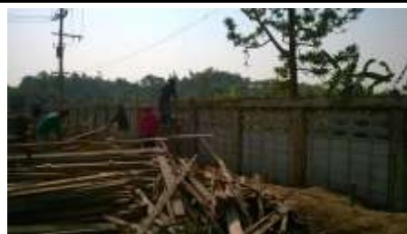
ขณะดำเนินการ